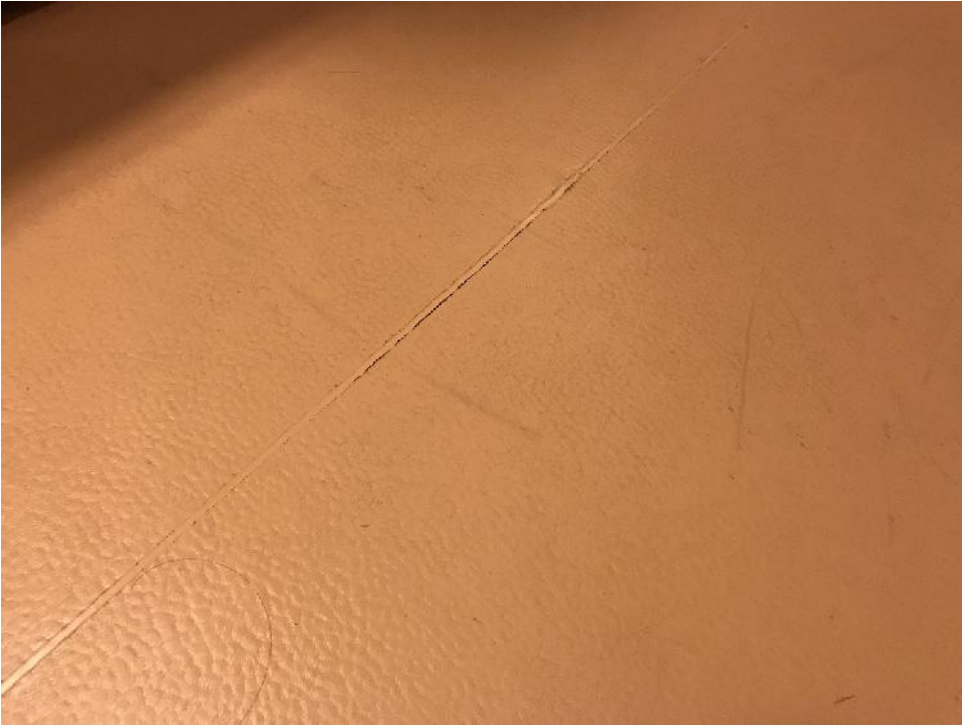
Muovimaton kutistumisesta johtuva epätiivis hitsausseama