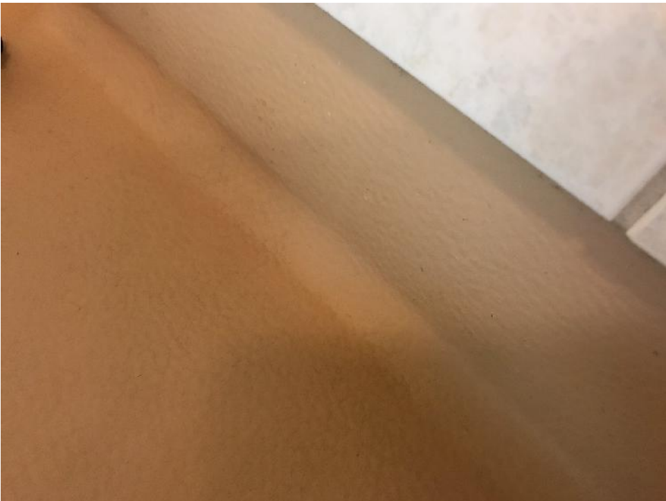
Muovimaton kutistumisesta johtuvaa seinänurkkien "pyöristymistä"