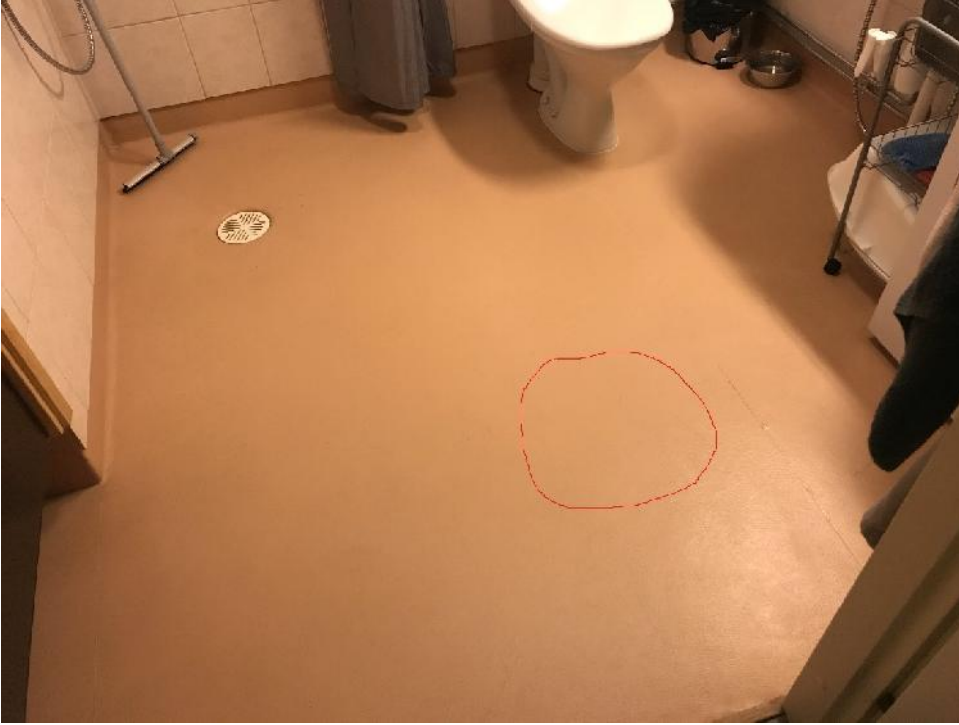
Vaurioalue kylpyhuoneen lattiapinnassa, jossa muovimatto on irti alustastaan