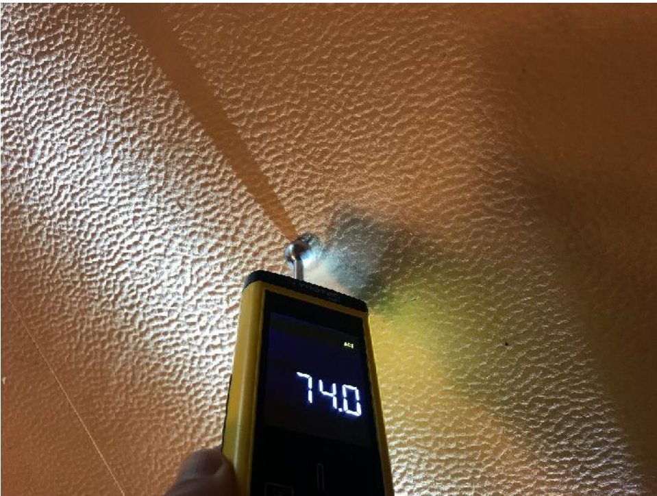
Koska lattiapinnan muovimatto on alustasta irronneelta alueelta ehjä, ei alueelta havaittu koholla olevia kosteusarvoja